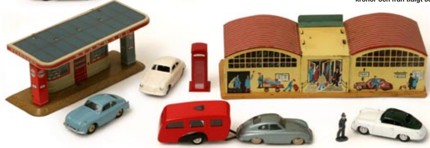
Standard-macken kommer från Tipp & Comp. Järnvägsstationen är troligen av tyska fabrikatet Techno-Fix. Vit Porsche från Märklin, en blå av märket Dinky Toys, en dansk Tekno med husvagn och polisbil från Märklin. Allt från 50-talet och bilarna i skala 1:43.