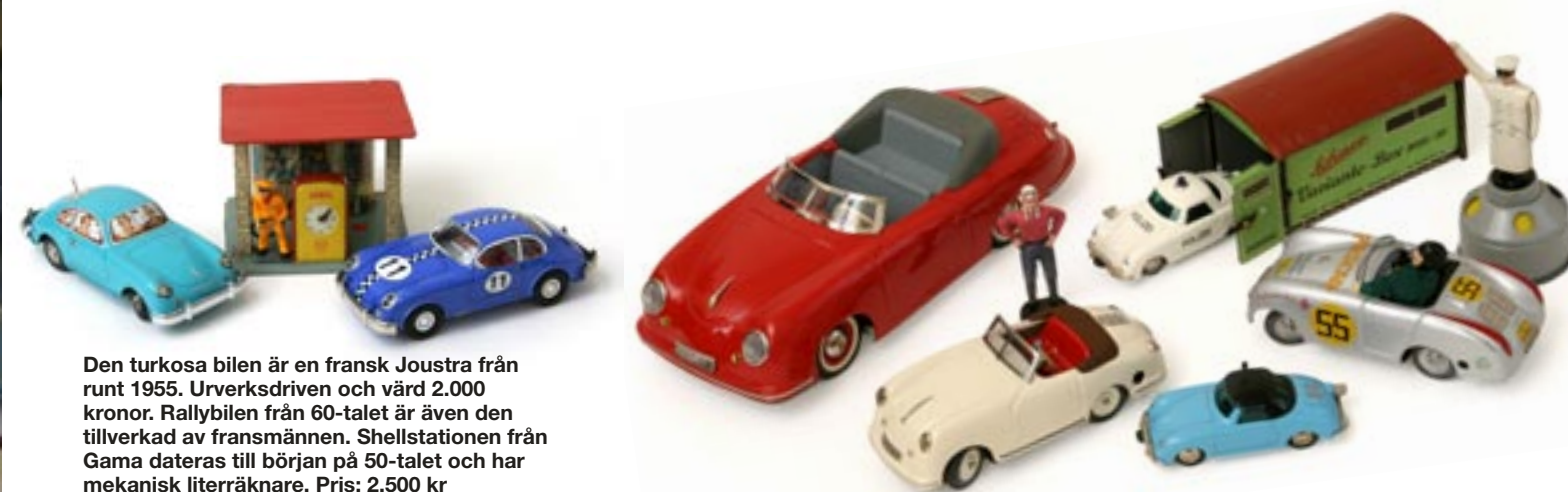
Den turkosa bilen är en fransk Joustra från runt 1955. Urverksdriven och värd 2.000 kronor. Rallybilen från 60-talet är även den tillverkad av fransmännen. Shellstationen från Gama dateras till början på 50-talet och har mekanisk literräknare. Pris: 2.500 kr

– Efter ett tag började jag att reparera leksaksbilar också. Folk ►