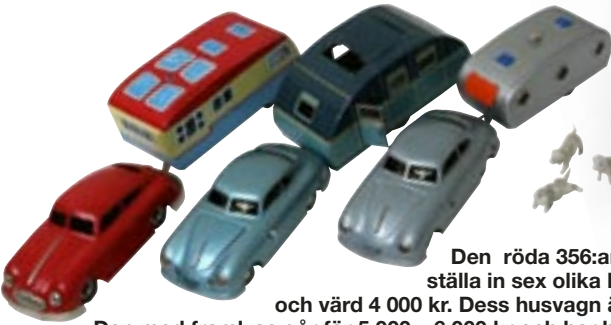
Den röda 356:an är Geschas så kallade Sixmobile vilket står för att du kan ställa in sex olika körprogram på undersidan. Från sent 50- eller tidigt 60-tal och värd 4 000 kr. Dess husvagn är en japansk Haji. JNF-Porscharna här kallades Prototyp. Den med framlyse går för 5 000 – 6 000 kr och har husvagn med taklucka gjord på 40-talet av Tipp & Comp. Den utan lyse är i mintskick och värd 8 000 kr. Dess husvagn kommer från japanska Haji.