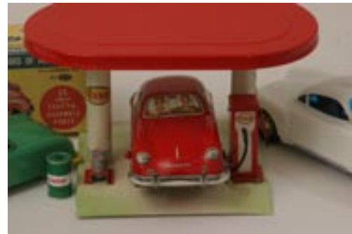
Byggsatsbilen i 35 delar kommer från amerikanska Ideal, är från mitten på 50-talet och prissatt till minst 5 000 kronor med kartong. Esso-stationen, en Kibri, ligger på 2 000 kr. Den friktionsdrivna franska Joustran är från mitten på 50-talet, pris 3 000 kr. Polisbilen, en Porsche Spyder, är gjord av Arnold, friktionsdriven med blinkljus och plastkaross från början av 60-talet.