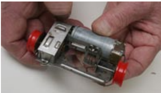
Distlers-365:an var den första leksakbilen med kullagermotor, som gjorde att batteriet räckte längre. Idén plockades senare upp av bland annat rakapparatsfabrikanter.