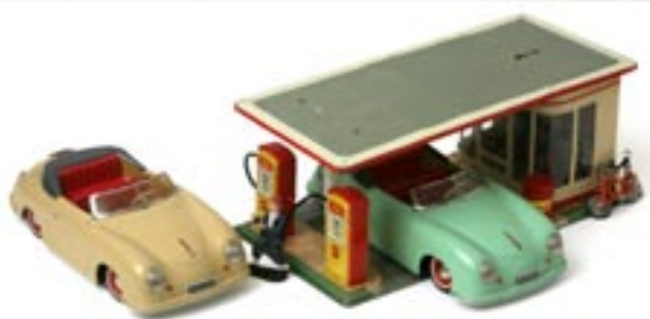
Beige är en sällsynt färg på en Distler. Den här har startnyckel, tre växlar, batteridrift och fjärrstyrning. Liksom den mintgröna är den från 1955–56. Senare modeller hade glaslyse där fram och vekad bottenplatta. Stationen är en Arnold, värd 3.000–3.500 kronor och från tidigt 50-tal.