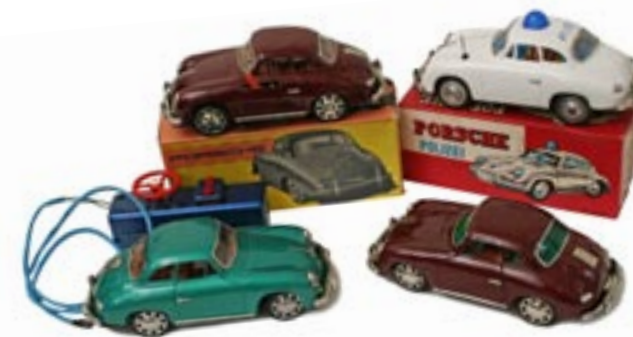
Vinröd japansk KS-Porsche med lyse fram och bak, polisbil med friktionsdrift och litograferad inredning, grön 356:a med batteridrift och fjärrstyrning och en enklare modell med friktionsdrift som Jalle restaurerat själv.