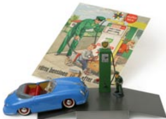
Kornblå Distler från slutet av 50-talet, med batteridrift och i prisklassen 6.000 kr. BP-tankstället är gjort av svenska Wexo och kostar runt tusen kronor. Almanackan som visar den 18 augusti 1962 säljs som replika i dag. Men det här är äkta vara.