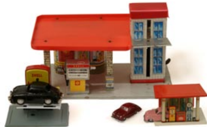
En Aschi-356:a på en hydraulhiss som är en så kallad Pennytoy, gjord av tunn plåt. Den stora Shell-stationen är tillverkad av Gama. De rosa och en vinröda bilarna kommer från Siku.