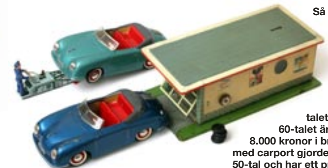
Så kallade Mexicofärger, alltså lite metallicstänk i kulören, är ovanliga. Dessa mexicoblå och mexicogröna exemplar från slutet på 50-talet eller början av 60-talet är värda 7.000–8.000 kronor i bra skick. Garaget med carport gjordes av Arnold på 50-tal och har ett pris på 3.000 kr.