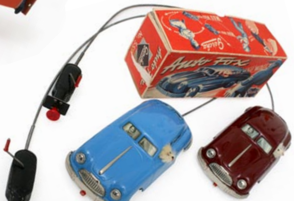
Tyska Gescha kom med Autofoxbilar på det tidiga 50-talet. Dessa hade på fjärrstyrningsvajern en knapp som fick en hund att titta ut och skälla. Ljudbälgarna i papper har dock slutat att fungera för länge sedan. Med kartong ligger värdet på hela 10.000 kronor.

► skickar bilar från hela landet till mig som jag hjälper dem med. Det är det roligaste av allt, att få trasiga bilar att fungera igen, berättar han entusiastiskt.