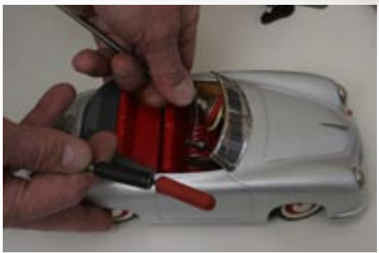
Styrvajern till Distler-Porschen sattes på ratten och växelspaken. Sedan kunde du gå upprätt och ratta sportbilen.